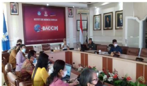
Pendampingan Manajemen Risiko