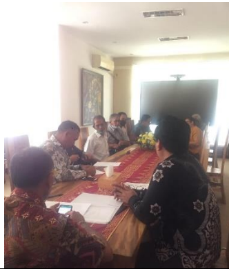
Kegiatan Audit dan Reviu