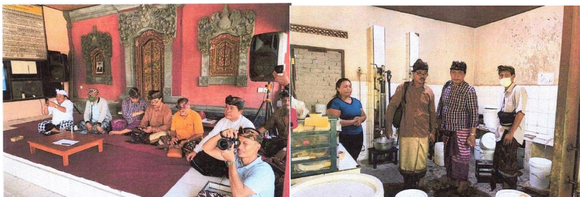
Monev Pengabdian Kepada Masyarakat